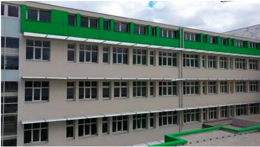
Здравствени центар Врање: 16 000 м 2 – близу 2 милијарде динара